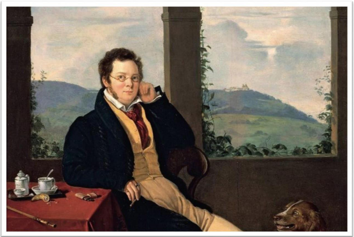
Трудный ребёнок с большим сердцем. Людвиг ван Бетховен